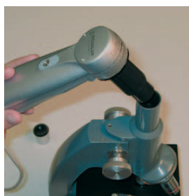
cámara para microscopio clásico