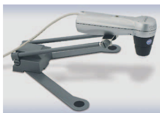
con soporte de mesa