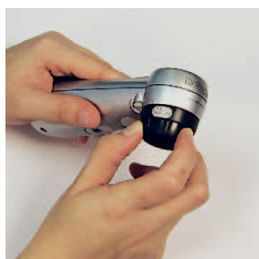
lente macro o webcam