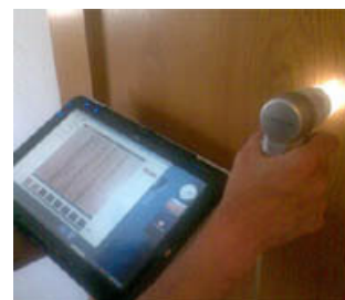
con PC portátil o Tablet PC